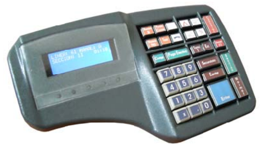
Consola de Conductor DCM-1030 (Opcional)